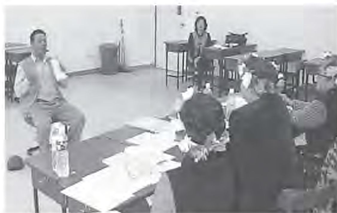
▲ 考生在口試時，比手劃腳的認真神情。

語言不只是溝通的工具，更是民族認同的基礎，文化命脈延續的依據。台灣原住民族語言的流失，導致的是文化的式微以及民族逐漸的消失，此將是台灣多元文化面貌的傷害，也是全人類文化資產的損失。族語振興運動，所欲力挽狂瀾的，就是搶救原住民族語言瀕危的命運，推動族語認證所引起的效應，確實也讓許多族人漸趨重視族語的價值，也願意投入振興族語的行列。族語認證考試所建立的初步成果，已帶動運動的風潮，如何讓此波行動持續加溫，是未來應再努力的方向。