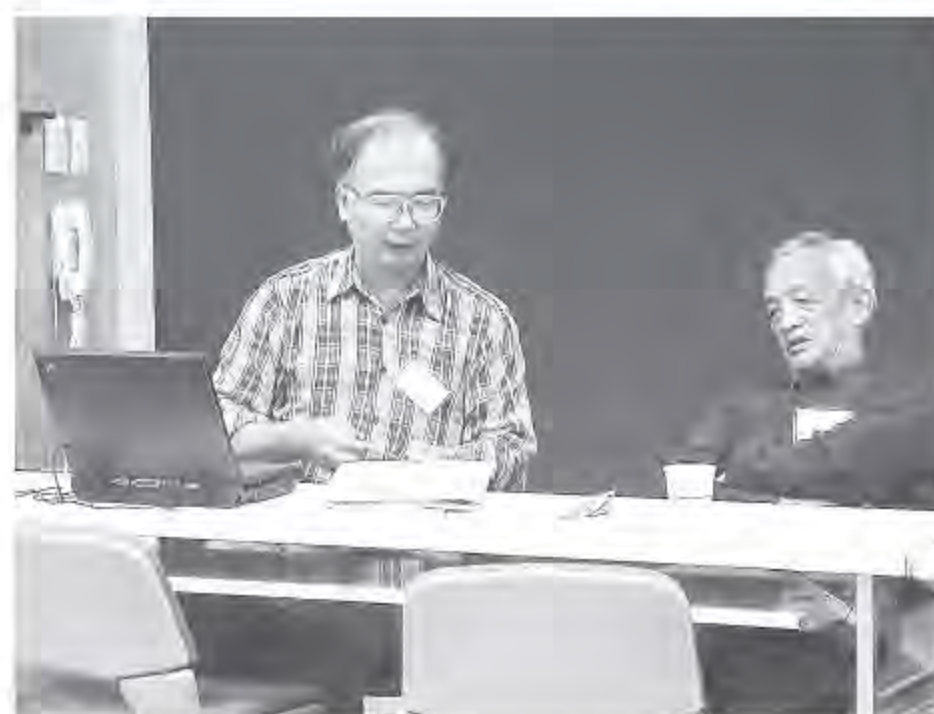
▲ 邵族認證委員命題時的討論情形。

究竟認證出來的族語師資是否足夠，以邵族為例，僅有2名考生通過筆試與口試，若再加上首屆認證時書面審查通過的1名考生，以3位族語師資來應付德化國小的族語課程，在人數上顯然單薄。其餘如汶水泰雅語、四季泰雅語、萬山魯凱語、萬大泰雅語、知本卑南語等，四年來通過的總人數皆在10人以下，若要全面推展族語並需要族語人才與符合資