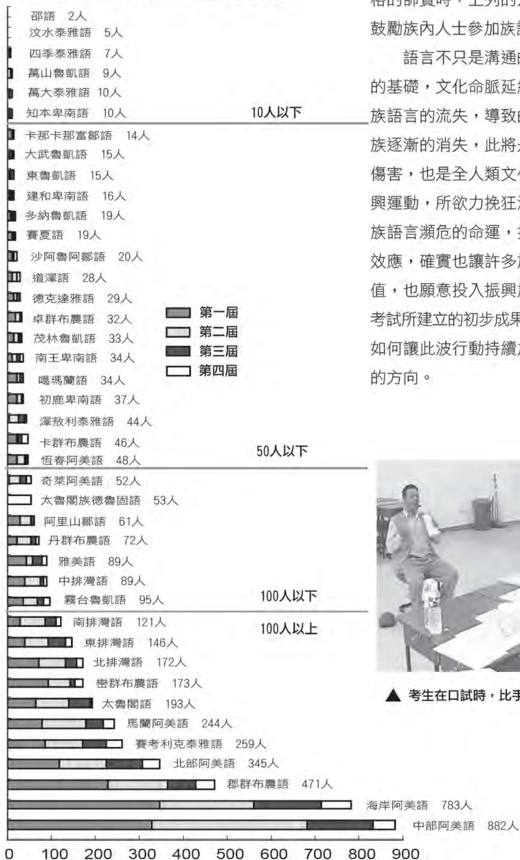
圖2 一至四屆族語認證各話通過考生人數條狀圖