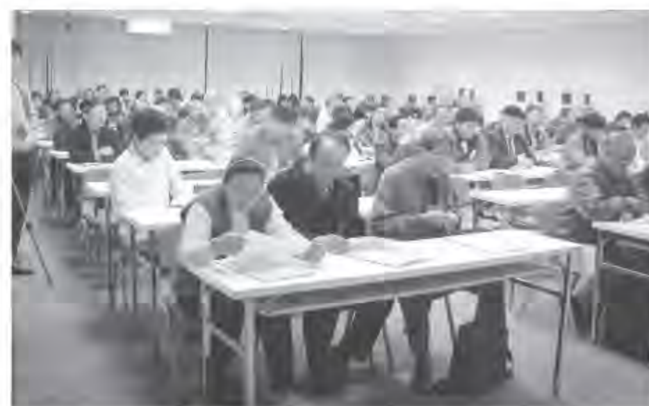
▲ 所有認證委員們為建立認證考試的制度齊聚一堂。