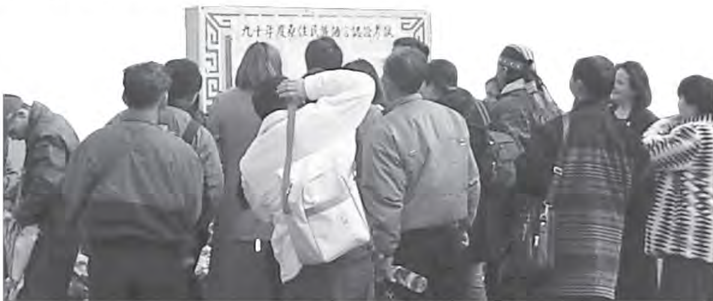
▲ 首屆原住民族語能力認證考試，台中考區考生在考場前觀看座位場地告示的情況。

由於每年一度認證試務工作的執行過程，都是一場原住民族語人才的動員，不但可藉以檢視族語在振興工程下的成效，也可體現族語的體質。本文即欲藉自政大辦理首屆之後，由台灣師大及東華大學辦理的三屆族語認證，以試務承辦單位的規劃、考生的參與狀況等，探討三校各持的理念與辦理的面貌。並對族語能力認證考試此項政策四年來的執行，提供一個全貌觀的分析，以為日後制定相關政策的參考。