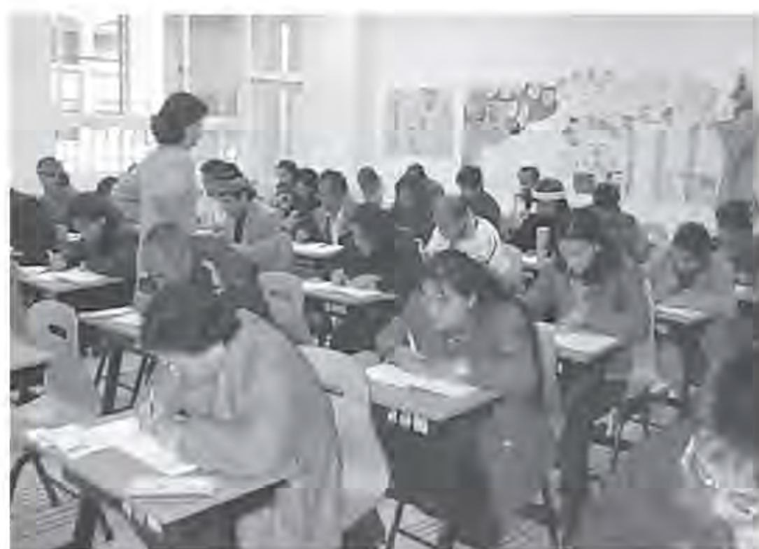
▲ 考生在筆試時的情形。