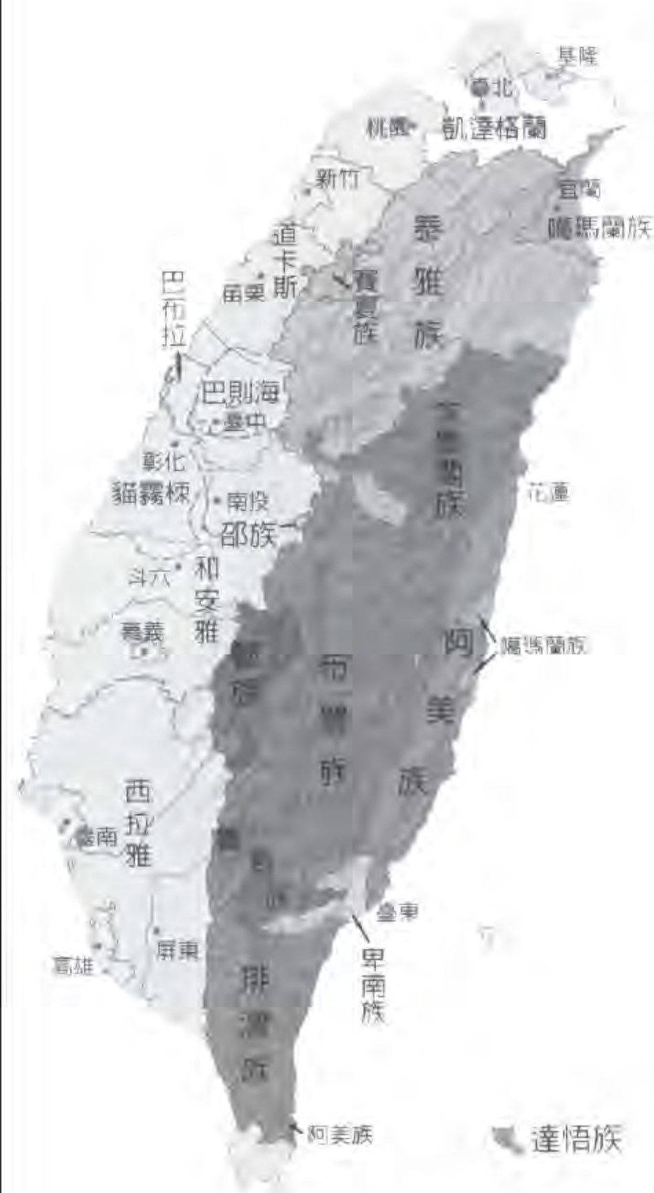
▲繪製精細的台灣原住民分佈圖，在課本的第55頁。

曾以「山地山胞」與「平地山胞」來區別居住在不同行政區的原住民。「原住民」之稱的出現，是原運團體在民國八〇年代要求正名後，才獲認定的名稱。