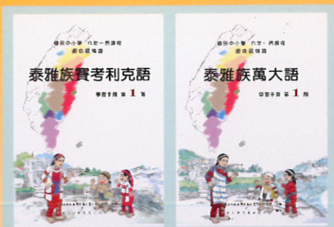
▲泰雅族萬大語及賽考利克語教材

原住民族第12族，是2004年從泰雅族獨立出來。當時取族名是根據花蓮習慣取為太魯閣族，以致於南投的自稱賽德克族的7千人不願意登記為太魯閣族，所以仍然停留在泰雅族裡。仁愛鄉登記為太魯閣族的人數目前是14人。賽德克族的爭取族名的運動已經熱烈展開，去年3月29日向行政院原住民族委員會申請認定，今年1月12日又舉行「賽德克族正名運動誓師大會」。