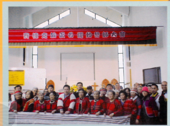
▲賽德克族誓師正名運動誓師大會