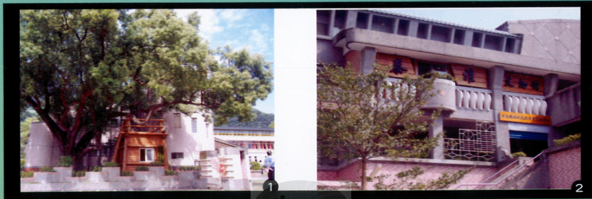
圖1:守護校園的瞭望台。

具有泰雅民族特色，以就地取材方式，呈現出自然風貌。還設有泰雅文物館，搭配原住民族資源中心，收藏泰雅服飾、生活器具、穀倉等文物。有各類專科教室，包括調酒餐飲、中餐烹飪、資訊、自然科實驗室、語言教室、美術教室、音樂教室、戶外階梯教室，更具備了原住民藝能教室。行政大樓與國中部大樓之間，可見到守護校園的瞭望台。另外，校園內也設置了泰雅風格的咖啡座，提供餐飲課程學生實習和全校師生休憩。