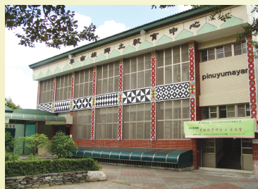
圖1：鄉土教育中心外觀

這間寫有卑南族輝煌教育史的百年學校，從卑南族唯一的小學，現在卻因地處台東市郊，學區不斷縮小，原漢混居，學童越區就讀，成為有併校危機的社區迷你原住民小學。目前學生134人，原住民學生僅剩91人，卑南族學生人數更不到全校七成。