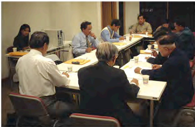
族語認證命題會議。

作，一同醞釀振興族語的潮流。而首屆認證號召全國近2,975人報考，規劃了6個考區，61間筆試試場，66間口試試場，以及205位口試認證委員的辛苦協助，可謂之為一場轟轟烈烈的大行動。所以，與一般語言檢定辦理模式不同的，基於重視民族發展與尊重民族主體性的原則，政大跳脫學術領導的作業模式，確實讓原住民自己擔任運動的推手，不僅，號召了這些族語人才，組成一龐大的認證委員團隊，也由其來主導族語書寫系統的討論、命題的執行、認證方式的確定等試務相關工作，乃至下