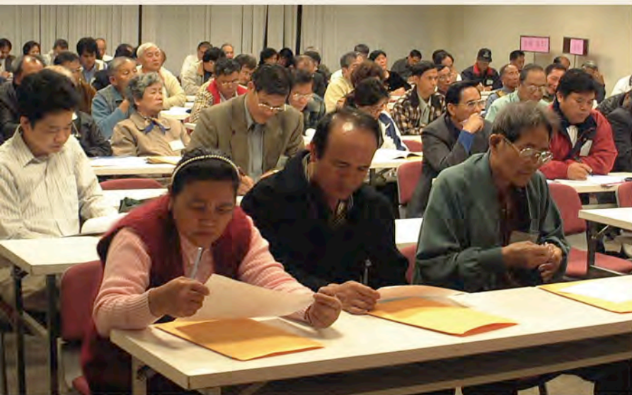
族語認證委員研討會。

足。有許多族人在看到通過族語能力認證的人也不怎麼樣，就更沒有想參加的意願。」賽夏族的武茂老師則提供賽夏族人對認證的想法：「雖然在第一屆時部分考生有想當族語老師的念頭，不過，也有人是擔