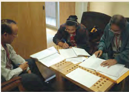
族語認證命題過程。

在進一步詢問受訪者為何人數會連年遞減時，則也獲得如下的回答。「部落裡族語能力較好，而且也會去考的人，大多是四十歲左右，這一批人在前三屆時，有意願的人大多已經考過了，所以，到了第四屆時，報名的人就比較少了。」「其他未參加的族人，可能是意願不高或是能力不