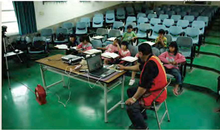
卡那卡那富鄒語教學。

同是鄉土語言教學支援人員，卻因經費來源不同，族語支援教學人員與閩客語的支援教學人員在待遇上天差地遠。例如：閩客語教學的相關經費來自教育部「2688專案預算經費」，列入地方政府預算固定時間撥入帳戶；而原住民族語教學支援人員的相關經費，係來自教育部「推動原住民英語及