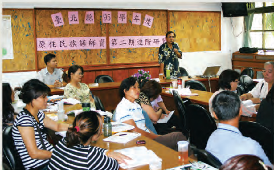
台北縣95學年度原住民族語師資第二期進階研習。

些待遇似乎合理，其實隱藏著嚴重的政策陷阱與不合理性。筆者曾多次在相關會議中反映此問題，但迄今仍未見具體回應及改善誠意。外界很少人知道，族語支援教師長期承受委屈，卻又不知如何是好。