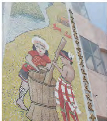
位於玉里鎮南方的長良派出所。