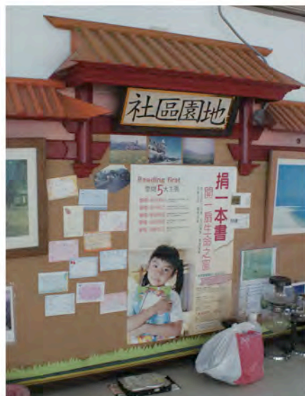
留言板上除了公佈社區的訊息外，也貼滿了小朋友製作的小卡片。

樣的信念，讓警員形成巨大的動力，主動帶領推動，長良派出所的成效才能如此顯著。當然，並不是每個派出所都有這樣的條件可以或需要成立，長良派出所的例子顯示出其特殊性，也讓一般大眾對於派出所有了不同的思考，讓人畏懼不喜歡靠近的派出所多了一份溫暖和人性。從佈告欄上貼滿的童言童語小卡可以深刻感受到學童們對於這裡的感情，以及對於警察叔叔的感謝，在書香和關愛的陪伴下相信他們的成長之路不會孤單。