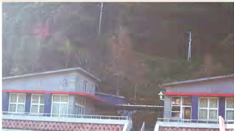
921災後重建的親愛國小。