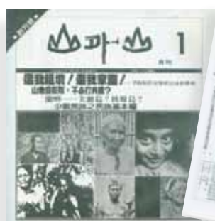
原權會於1985年發行《山外山》月刊。

1985年2月～1992年2月，《原住民》共發行11期，除了與原權會相關的會務報導外，還有服務資料統計、抗爭歷史資訊、原鄉部落新聞、族語學習單元等等。為了不受新聞局的干擾，1985年7月，正式發行《山外山》月刊，內容包括「原住民論壇」、「原住民文藝」、「特別報導」、「人物專訪」等等，做為傳達原住民族運動的重要理念。不知道什麼原因，很可惜的是這本刊物的壽命很短，只有創刊號1期。