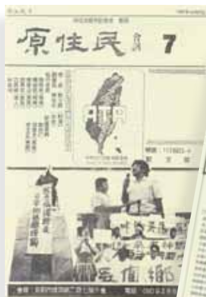
原權會的會訊《原住民》。