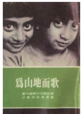
少數民族委員會出版的《為山地而歌》。

1984年4月台灣黨外編輯作家聯誼會成立「少數民族委員會」（簡稱少委會），該會主要是聯合