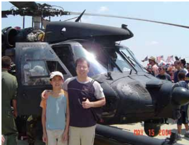
參觀美國安德魯空軍展。