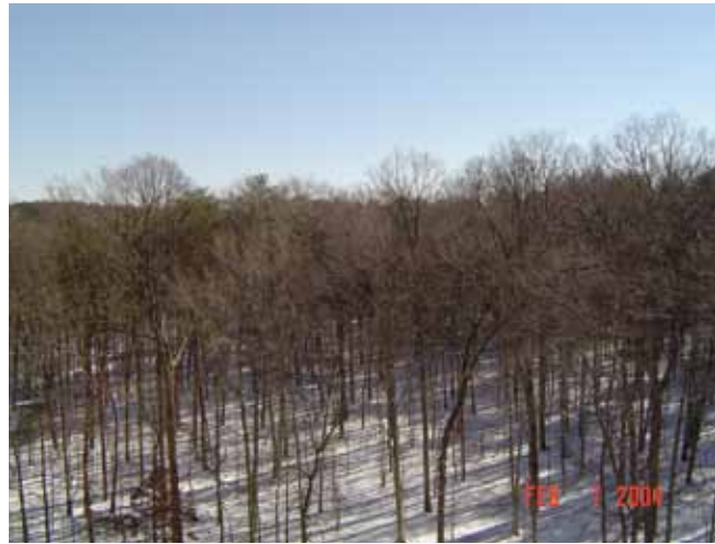
宿舍前的森林公園。