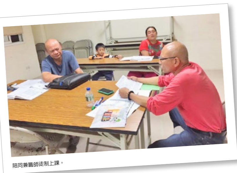
陪同兼職師徒制上課。

當火苗竄出，我必須小心翼翼地照看他的狀態，再適時添上一些輔佐教材，讓火苗可以接受，運用教材，更發長大；當火苗奄奄一息，我就開始緊張了，是學習課程中有摩擦？還是在課程、時間安排上有狀況？若火心直燒老杉柴，新柴點不燃，那捆新柴就會將