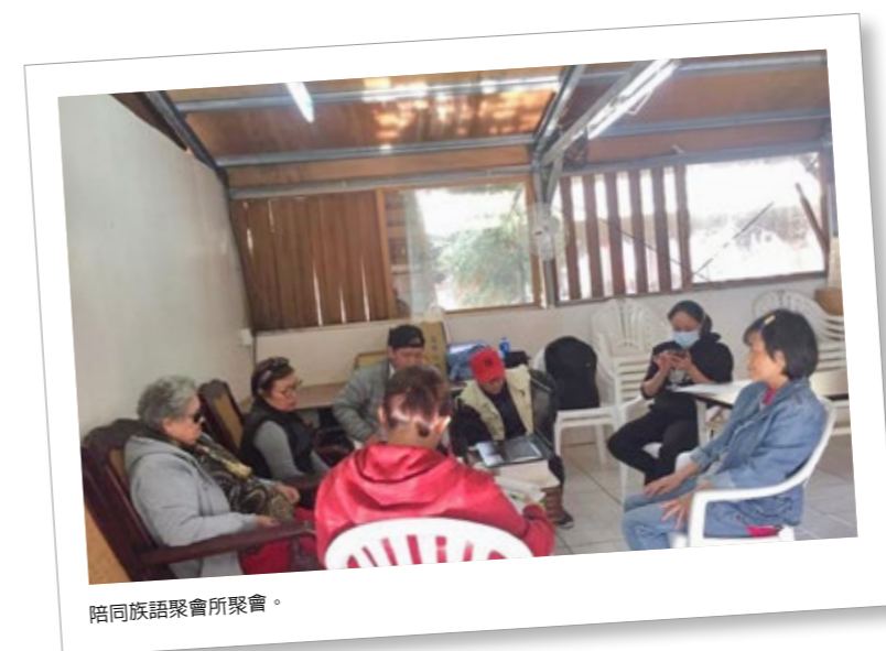
陪同族語聚會所聚會。

師要顧及出席率正常的學員，給他們延伸的課程，又要顧及出席率浮動的學員，讓他們趕快跟上進度，如同火心直燒老杉柴，總有一天老師的熱情和體力，會被磨耗殆盡。解決之道就是委婉勸退，並設計課程，將複習排入學習目標之中，並且記錄延伸課程內容，下次能夠再應用於其他課程。將不適合燃燒的柴挑走，重新安排捆一束薪柴，再次點燃。老