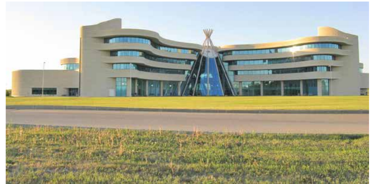
2003年加拿大在薩克其萬省建立了第一所第一民族大學，其間發展出以原住民族研究專業學術刊物，並形成學術和原住民族社區之間的合作關係。

住民族學生的學力表現與社會參與。因此，原住民族學生中心有助於將這一群體留在高等教育體制當中。舉例而言，建立一個讓原住民族學生能夠參與的學習環境，例如營隊、聚餐等社會與文化活動，且建構一個原住民族同儕的社交網絡，便可使其產生歸屬感、接納感及生命經驗認同等正向的影響。