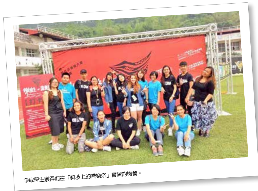
爭取學生獲得前往「斜坡上的音樂祭」實習的機會。

實踐大學休閒產業管理學系（休產系）立基於本校創辦人謝東閔先生辦學理念，闡揚王陽明先生所提倡之知行合一、即知即行之生活哲學，循著謝孟雄董事長力倡教學實