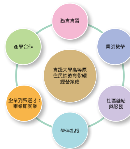
實踐大學原住民族高等教育永續發展機制圖

企業到系選才、畢業即就業： 邀請在台灣具有領導地位之合作企業到系面試學生，提供在校學生與畢業生具有保障、且有發展前景的實習與正職工作機會。