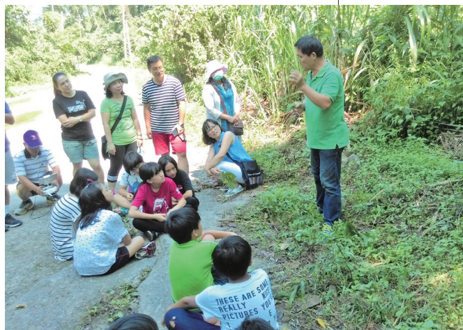
博屋瑪國小文化指導員於田野中教導學生認識泰雅族植物與野菜。

以上僅就民族教育實驗計畫中的二項重要任務說明其複雜與不易程度，設若再加上整體校務的負擔，更可見實施民族教育實驗計畫之不易。因此，筆者大聲呼籲不論教育行政單位、學校、教師們，務必認識何以需有一年籌備期來進行課程發展與教師專業成長，而不應在籌備的第一年即貿然進行所謂的試辦，以保障學生的受教權，確保民族教育實驗計畫的成功。◆