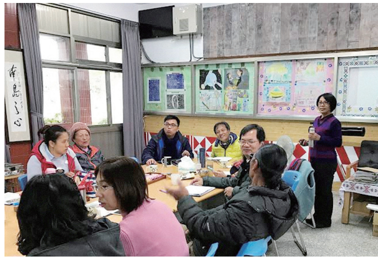
筆者與南王國小耆老、教師進行課程發展。

教師專業發展需在現有基礎之上增強功力與武藝，但時間與資源相對不利： 民族教育實驗計畫一方面要增進原住民學生的民族文化知能認同，另一方面要提升學生的基本能力。在這雙重目標的驅使下，學校教師就得再入山修行，一方面增進關於學生身心發展、原住民族文化、學科知識、教育哲學與原理等等知識的