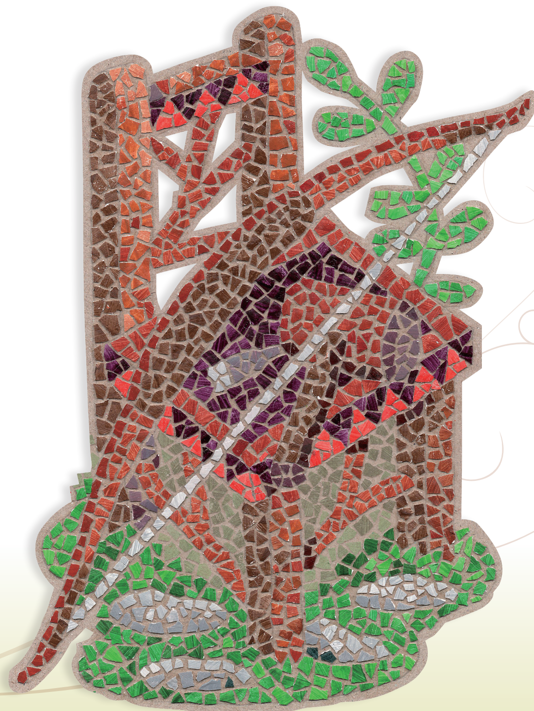
插畫設計 Illustration : 陳枝烈