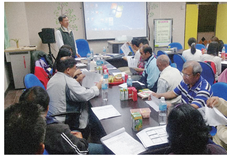
筆者與樟山國小耆老、教師進行課程發展。

正如過去幾個推動民族教育的階段那般，截至目前為止，這次有台中市博屋瑪國小，高雄市民族大愛國小、樟山國小、多納國小，屏東縣地磨兒國小、長榮百合同國小，台東縣南王國小、土坂國小推動民族教育實驗計畫。這些