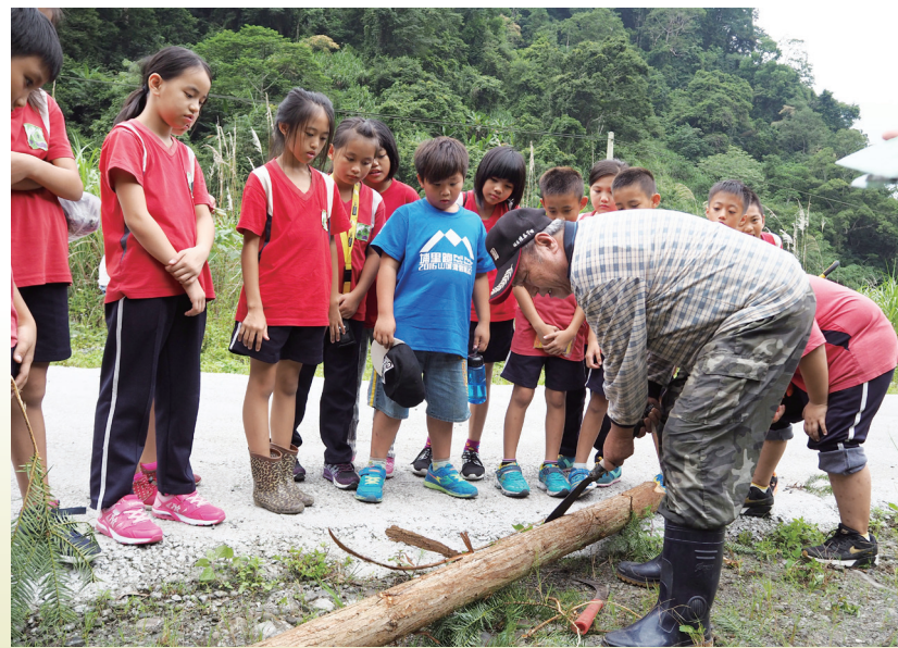
博屋瑪國小學生於山林中學習認識傳統建築建材—檫木。

基於前述，一些原住民族地區的學校就像找到了回命丹丸，開始推動原住民族教育實驗計畫。雖然這些學校的實驗計畫內涵與模式並不相同，有的是以某一原住民族文化融入某一領域進行文化回應教學（例如土坂國